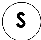
Darstellung mit Anschlussleitung (Symbol)

Die Richtlinie über die Vermessung von einfachen Hausanschlüssen wurde entsprechend ergänzt.