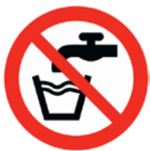
Abbildung 2: Zeichen für „Kein Trinkwasser“

Nichttrinkwasserleitungen sind nach der Trinkwasserverordnung und nach DIN 2403 eindeutig und dauerhaft farblich unterschiedlich zu kennzeichnen, damit es zu keiner Verwechslung kommt. Alle Entnahmestellen der RWNA sind mit einem Schild „Kein Trinkwasser“ oder dem Bild (Abb.2) zu kennzeichnen.